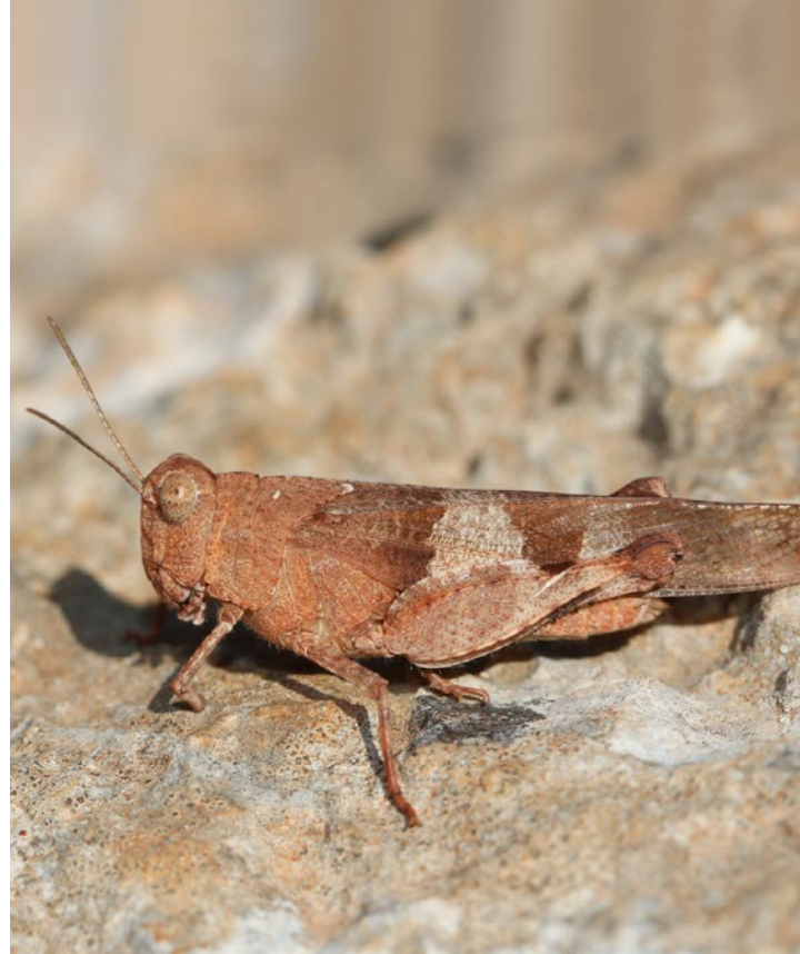
Blauflügelige Ödlandschrecke

zelne Sträucher die Weidelandschaft. Hier ist ein Neuntöter-Pärchen ( Lanius collurio ) beim Beutefang zu beobachten. Der auch als Rotrückenwürger bekannte, etwa sperlingsgroße Vogel zieht im September als Zugvogel nach Ost- und Südafrika. Er baut sein Nest bevorzugt in Bodennähe mitten in einen Dornenbusch.