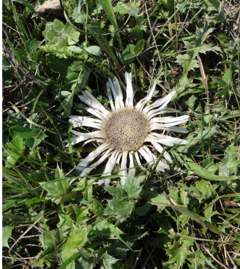
Silberdistel (grünes handwerk - M. Ressel)