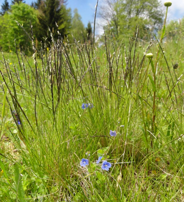
Bürstling (grünes handwerk - M. Ressel)