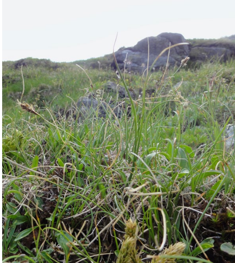
Krumm-Segge (grünes handwerk - M. Ressel)