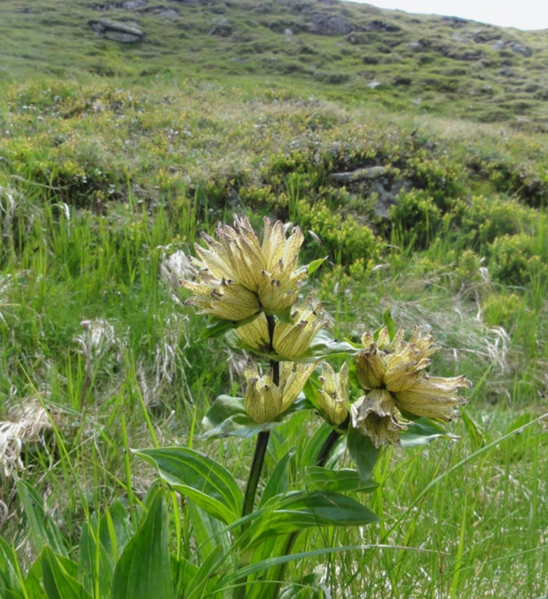
Tüpfel-Enzian (grünes handwerk - M. Ressel)