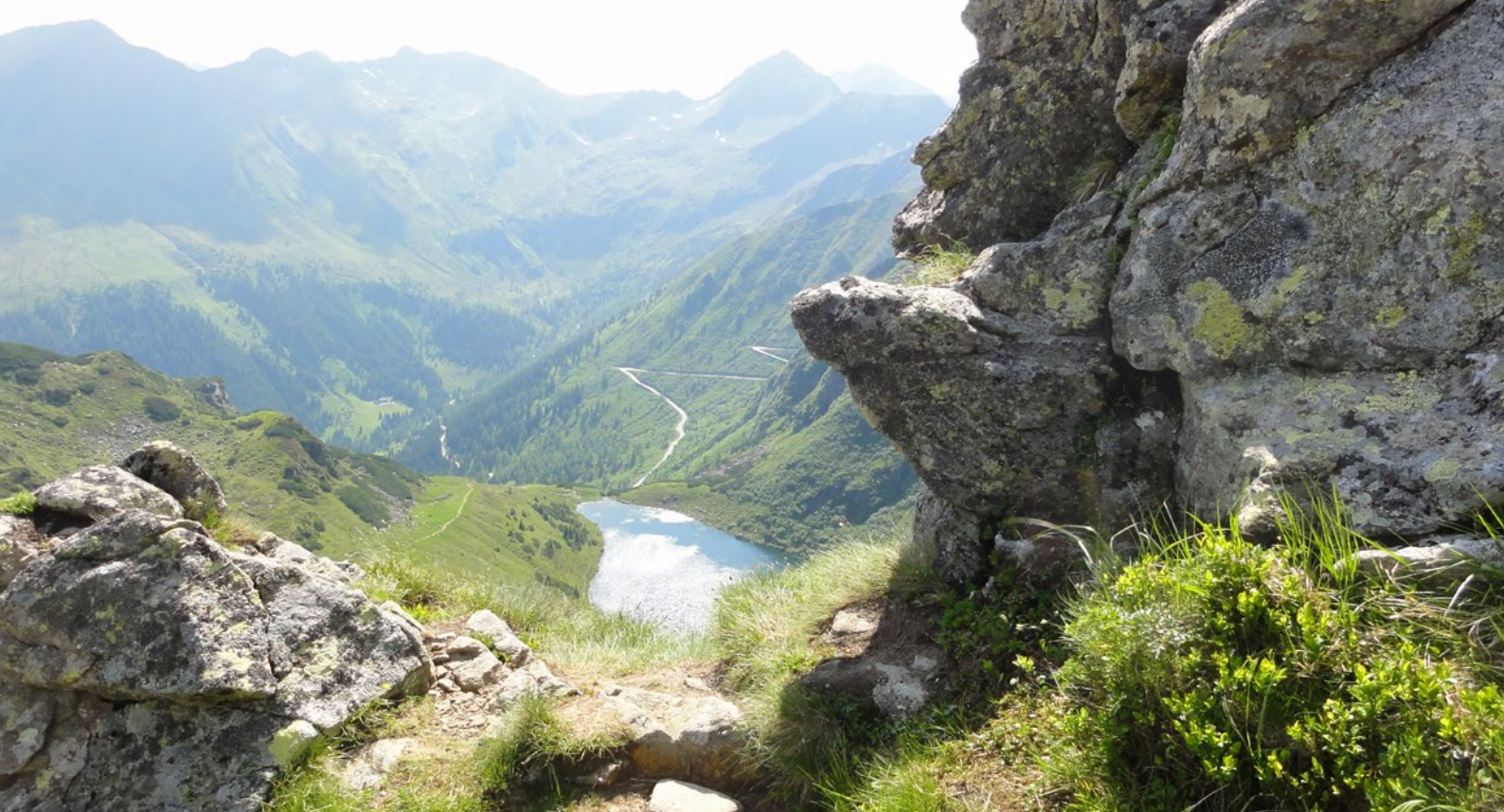
Unterer Kaltenbachsee